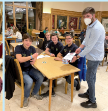
1. Platz Junioren BJB Parnkofen II