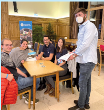
1. Platz Senioren Kolpingjugend Landau II

Am 5. November trafen sich 143 Jugendliche, um gemeinsam ihr Wissen in zehn Kategorien zu testen. Breit gestreut waren die Fragen über Geschichte, Notenlesen oder Rezepte erkennen bis hin zu einer Runde Pantomime. Besonders viel Spaß hatten die Teilnehmer beim Tierlaute erkennen, bei der man durch Hörbeispiele erkennen musste ob es sich z. B. um einen Waschbären, einen Waldarbeiter oder einen Specht handelt. Eine etwas schwierigere Runde, war die Bestimmung von Liedern, bei der die Jugendlichen anhand von Notenzeilen oder Texten, die Lieder erraten mussten. Am Ende konnte sich durch eine Stechfrage die Kolpingjugend Landau II den ersten Platz, die KLJB Loiching den zweiten Platz und der Sportkegelclub Dingolfing den dritten Platz sichern. Den Juniorenpreis gewann die BJB Parnkofen II. Der Mehrheitspreis ging an die KLJB Aufhausen, die mit 22 Teilnehmern startete. Ein besonderer Dank gilt dem Landgasthof Apfelbeck für die Bewirtung und die Spende von Pizzen und Pommes als Preise.