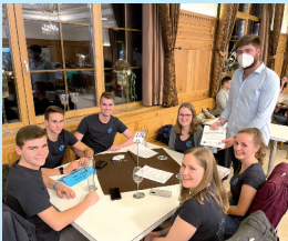
2. Platz Senioren KLJB Loiching